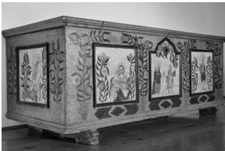
Slika 5: Stara skrinja v hiši pri Ažbetu doma.