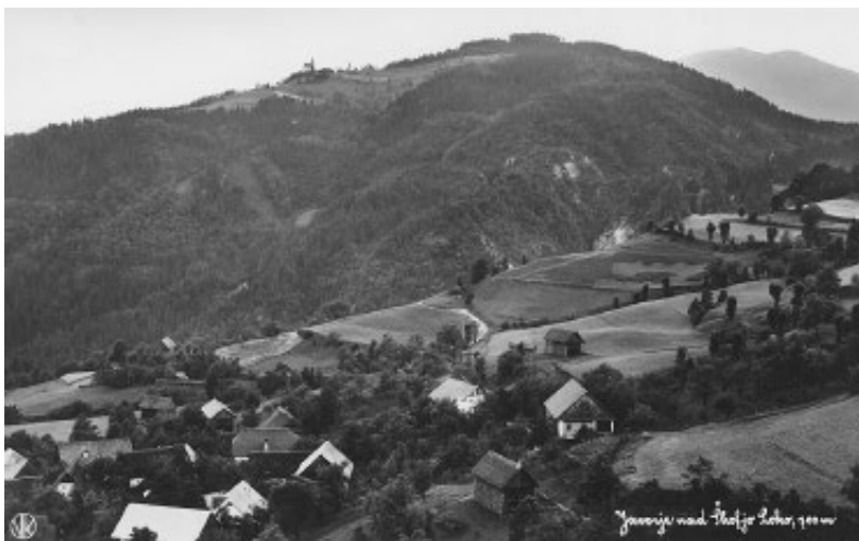
Slika 1: Dolenčice nad Škofjo Loko med letoma 1928 in 1947. V sredini spodaj stoji stara Ažbetova hiša, hlev in dva kozolca. V ozadju na sredi je Malenski vrh s cerkvijo Marijinega vnebovzjetja, na skrajnem zgornjem desnem robu pa Blegoš.