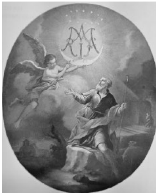
Slika 3: Leopold Layer, Angel prinaša sv. Joahimu Marijino brezmadežno ime v podobi monograma . Olje na platno. Slika je bila do leta 1938 v cerkvi sv. Tilna v Javorjeh, nato pa prodana v Narodno galerijo.

(1795–1810). Razporeditev svetlobe sledi ostri diagonalni kompoziciji na način, da stopnjuje chiaroscuro 19 in s tem dramtizira dogajanje na sliki. Janezova glava je skoraj identična Aronovi. 20