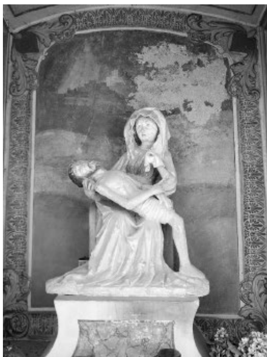
Slika 6: Poznogotski kip Žalostne Matere Božje je delo ljubljanske delavnice iz zadnje četrtine 15. stoletja. Prvotno je bil del zasebnega oltarja v cerkvi.